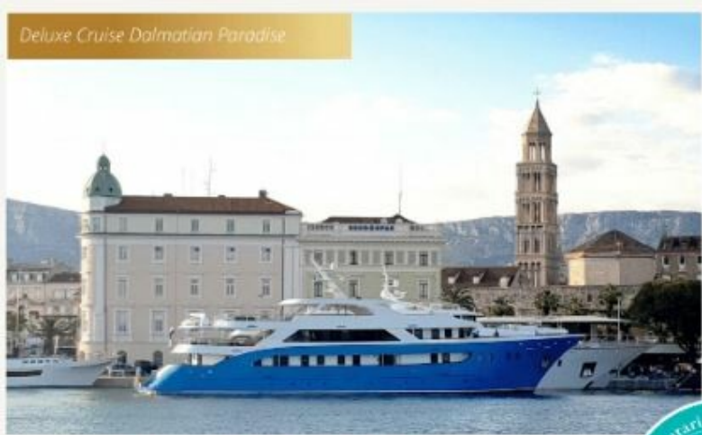
MV SAN ANTONIO or similar